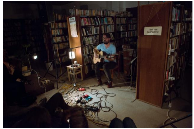
Koncert Archívneho chlapca v Karloveskej knižnici

Neviem čo presne pod tým myslíš, ale ak myslíš v knižnici samotnej, tak je to ako som už vrazil, venovať sa deťom, ktoré majú stále ešte čistú snahu poznávať. Keď sa niečo potom na prvom stupni základnej pokazí v nich, čo môže a nemusí, ale žiaľ pozorujem, že vďaka systému výučby a učiteľom, akých systém v sebe vyrába, sa tak často stane. Nezaujímam sa u detí horšie ako hocikaké iné diagnózy. To ma veľmi baví, keď vidíš, že kniha, myšlienka, nápad u nich zafunguje. Jasné, ešte tá hudba, tú ja vidím všade aj v knižnici.